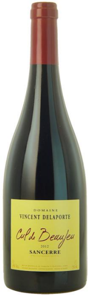
[Le vin d'hier soir]